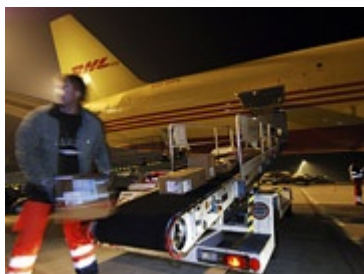
DHL baut den Flughafen Leipzig/Halle zum Frachtdrehkreuz aus. Bis zu 3000 Arbeitsplätze sollen entstehen.

Im November 2004 hatte DHL angekündigt, sein europäisches Frachtdrehkreuz vom Brüsseler Flughafen Zaventem nach Leipzig/Halle zu verlagern.